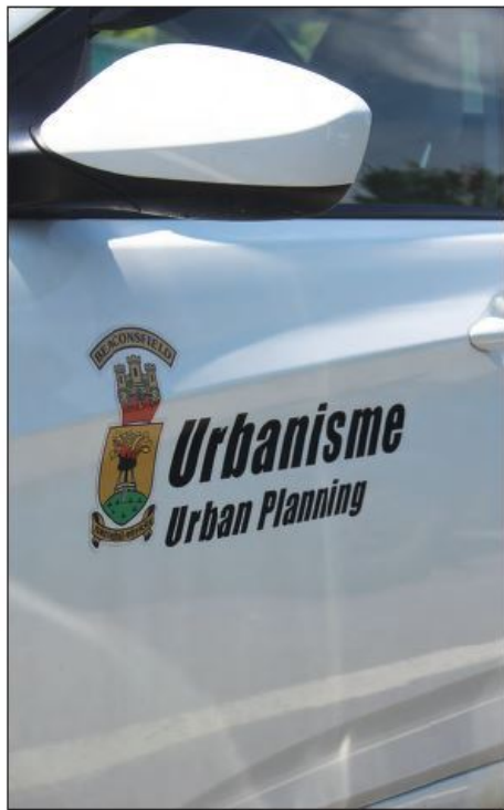
Le groupe pour le mur antibruit affirme que la planification urbaine de Beaconsfield n'aurait jamais dû autoriser de nouvelles résidences à côté de l'autoroute 20.

En même temps, il dit que la Ville a accordé des permis de construction pour de nouvelles résidences dans le corridor du bruit de l'autoroute 20.